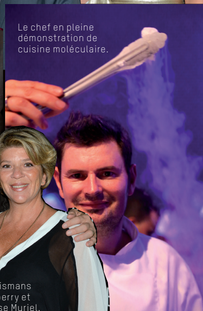
Le chef en pleine démonstration de cuisine moléculaire.