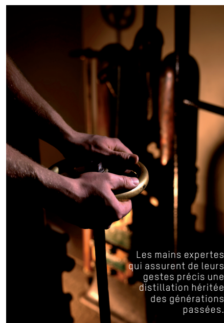
Les mains expertes qui assurent de leurs gestes précis une distillation héritée des générations passées.

On l'aura compris, Absolut se singularise en cherchant à surprendre et à séduire toujours davantage. Après 130 années de distillerie, le management de la firme continue cette politique de charme. Ainsi, au milieu des années 80, l'entreprise a fait appel à Andy