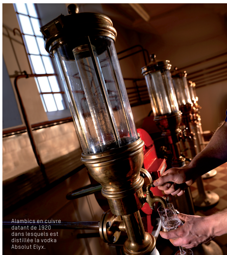
Alambics en cuivre datant de 1920 dans lesquels est distillée la vodka Absolut Elyx.

Blé d'hiver cultivé et sélectionné à la main chaque été pour réaliser une vodka single-estate .